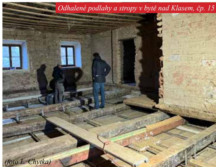
Odhalené podlahy a stropy v bytě nad Klasem, čp. 15

Připravuje se výstavba nového bytového domu v lokalitě po zdemolovaném čp. 51 (Firfan, Mlsna), dále úprava sociálního zařízení v Temelínské hospodě tak, aby se dala plnohodnotně využívat jen část se sálem a přísálím, je vydané stavební povolení na ZTV Sady1, na odkanalizování ZTV Sady1 a na rekonstrukci plynového přívaděče ZTV Sady1. V současné době čekáme na realizační projekt, který by měl být připravený na jaře. Pokud ho zastupitelstvo schválí, může se i zde začít s pracemi.