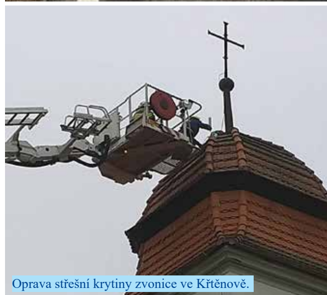
Oprava střešní krytiny zvonice ve Křtěnově.