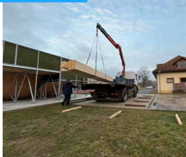
Odstraněné torzo pergoly ve Lhotě, skládání trámů na novou