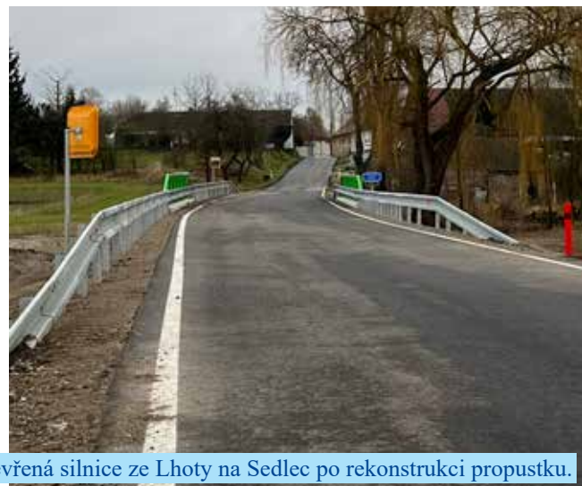
Otevřená silnice ze Lhoty na Sedlec po rekonstrukci propustku.