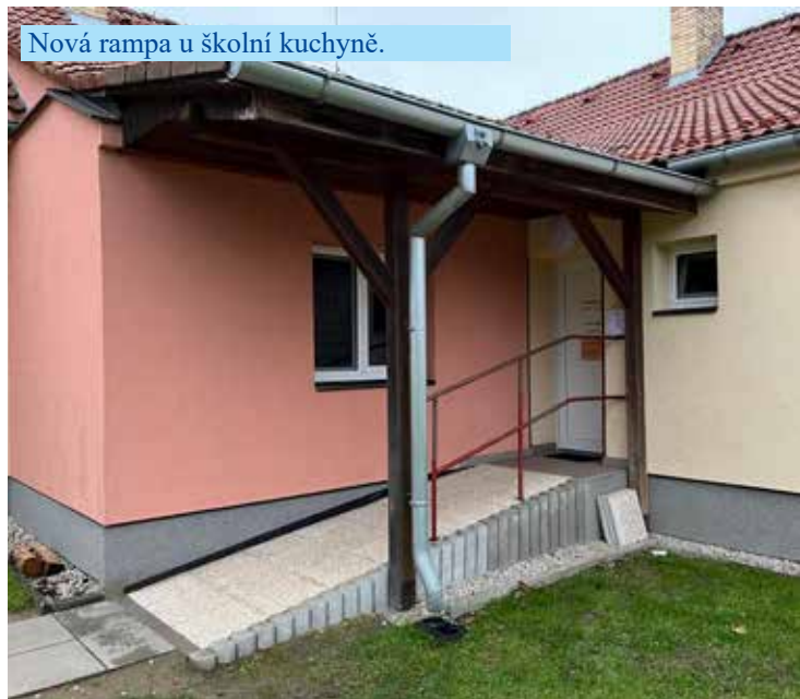
Nová rampa u školní kuchyně.