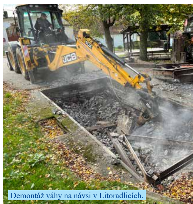
Demontáž váhy na návsi v Litoradlicích.