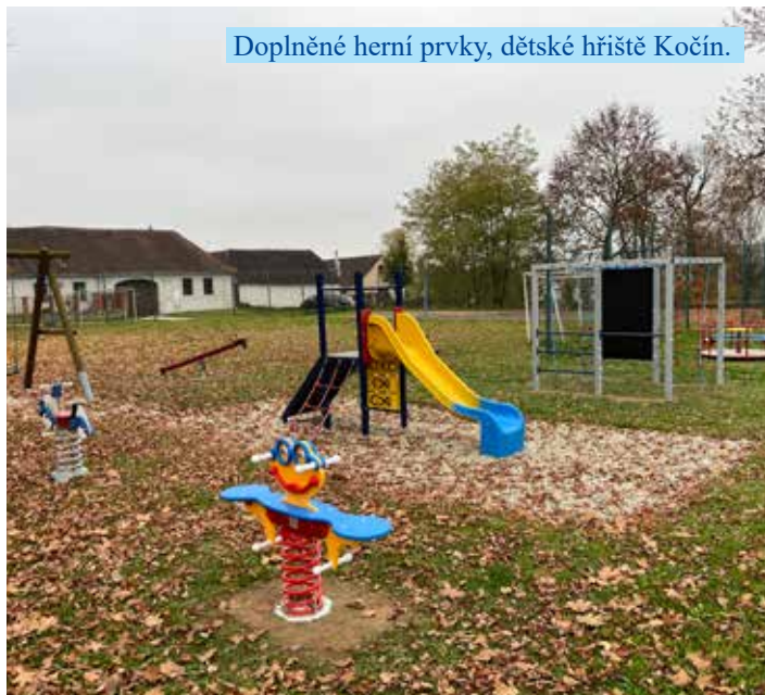
Doplněné herní prvky, dětské hřiště Kočín.