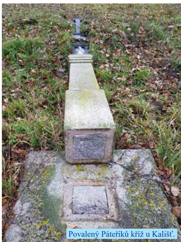
Povalený Páteříkův kříž u Kališů.