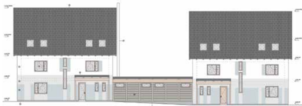
Bytový dům Mlsna - pohled severní

Tak to jen pro představu, že stavba čehokoliv není jen a pouze o penězích.