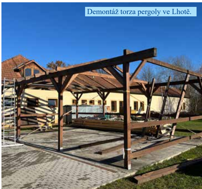
Demontáž torza pergoly ve Lhotě.