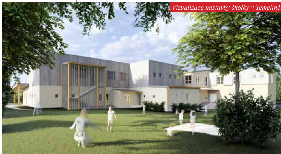
Vizualizace nástavby školky v Temelíně

Ve škole jsme upravovali třídy, protože školka otevírala druhou třídu a potřebovala vyhovující prostory. Školka se nyní nachází v 1. i 2. patře, školka se částečně přesunula do