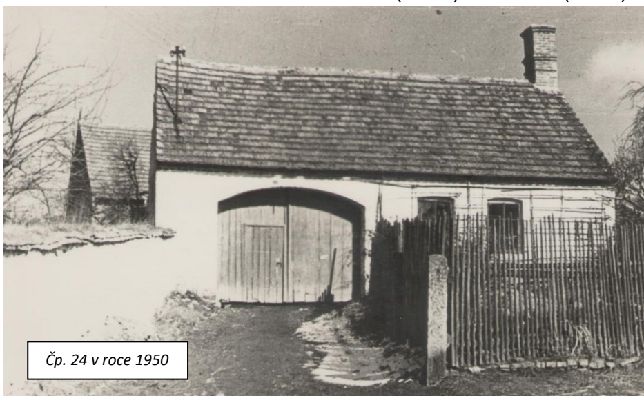
Čp. 24 v roce 1950