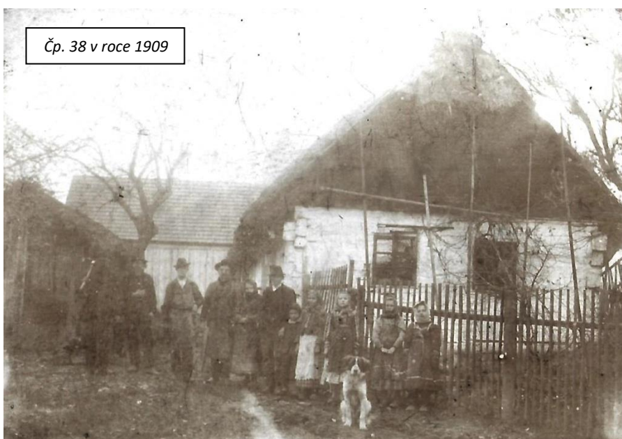
Čp. 38 v roce 1909