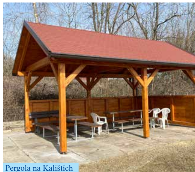
Pergola na Kalištích