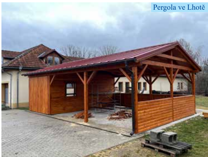
Pergola ve Lhotě