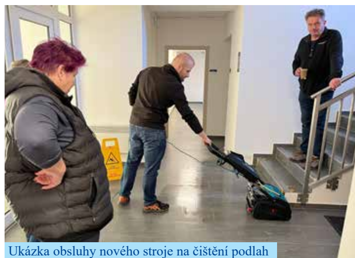
Ukázka obsluhy nového stroje na čištění podlah