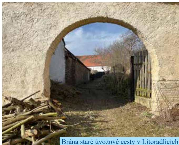
Brána staré úvozové cesty v Litoradlicích