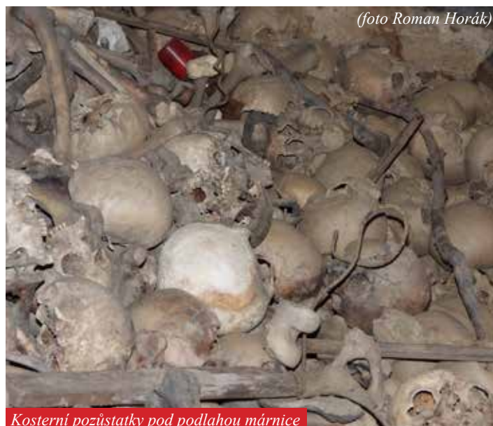
Kosterní pozůstatky pod podlahou márnice