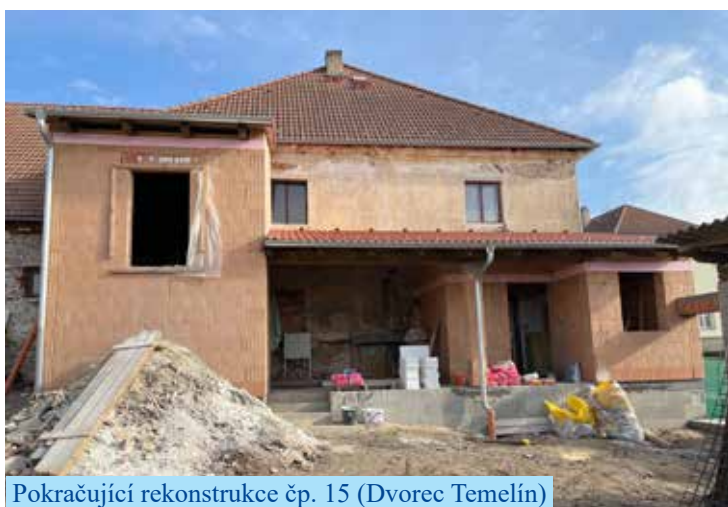
Pokračující rekonstrukce čp. 15 (Dvorec Temelín)