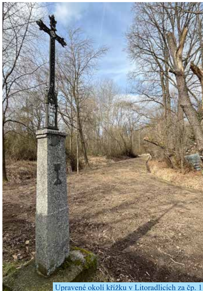
Upravené okolí křížku v Litoradlicích za čp. 1