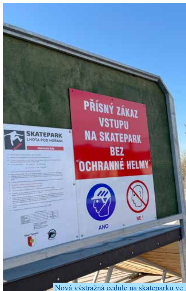
Nová výstražná cedule na skateparku ve