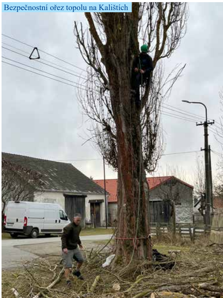
Bezpečnostní ořez topolu na Kalištích