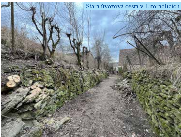
Stará úvozová cesta v Litoradlicích