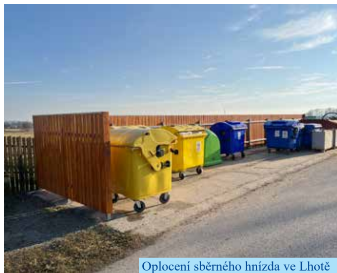
Oplocení sběrného hnízda ve Lhotě