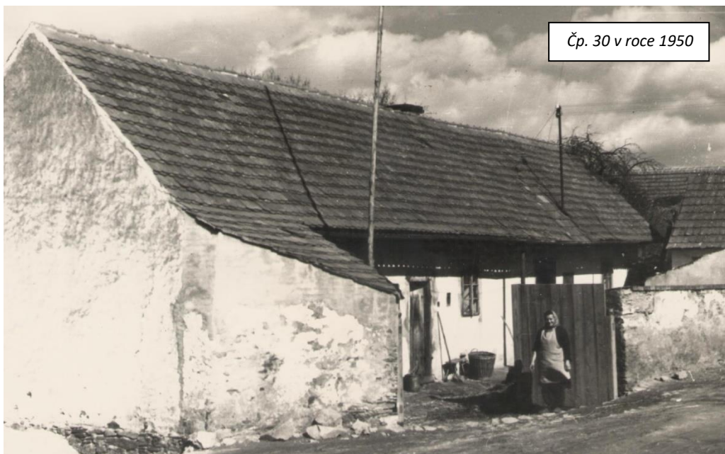
Čp. 30 v roce 1950