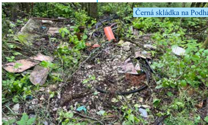
Černá skládka na Podhájí