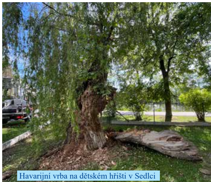
Havarijní vrba na dětském hřišti v Sedlci