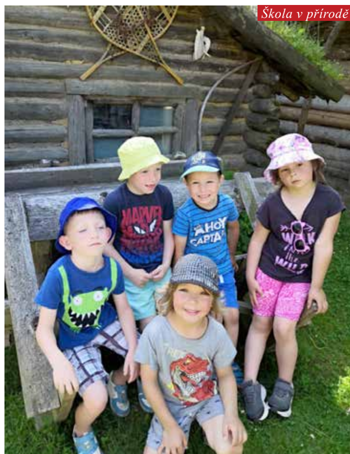
Škola v přírodě