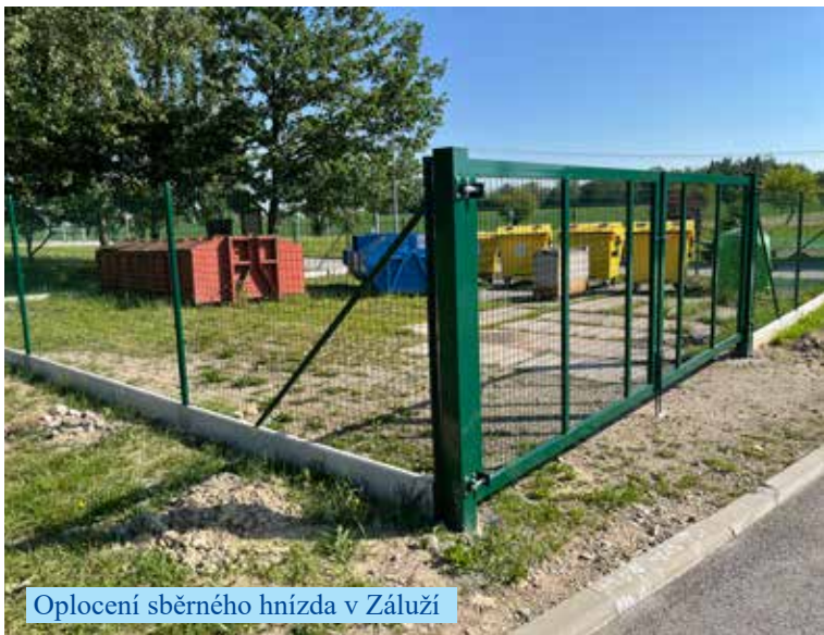
Oplocení sběrného hnízda v Záluží