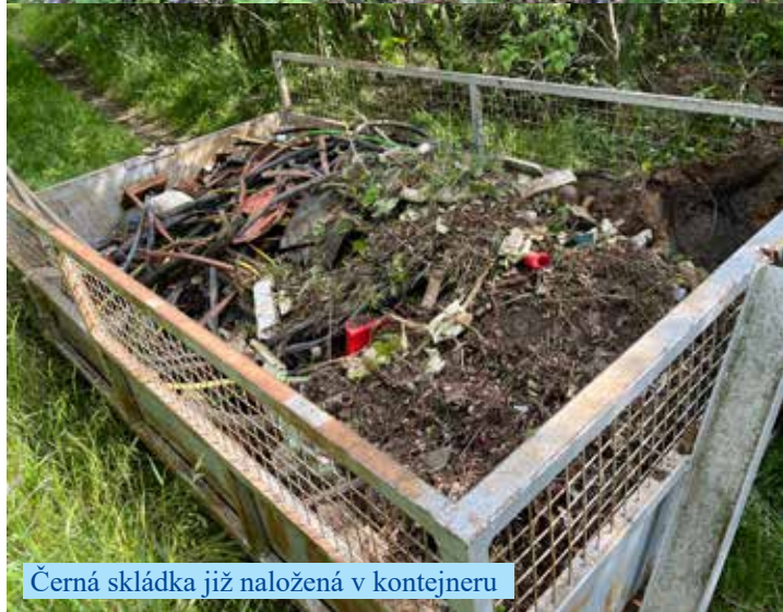
Černá skládka již naložená v kontejneru