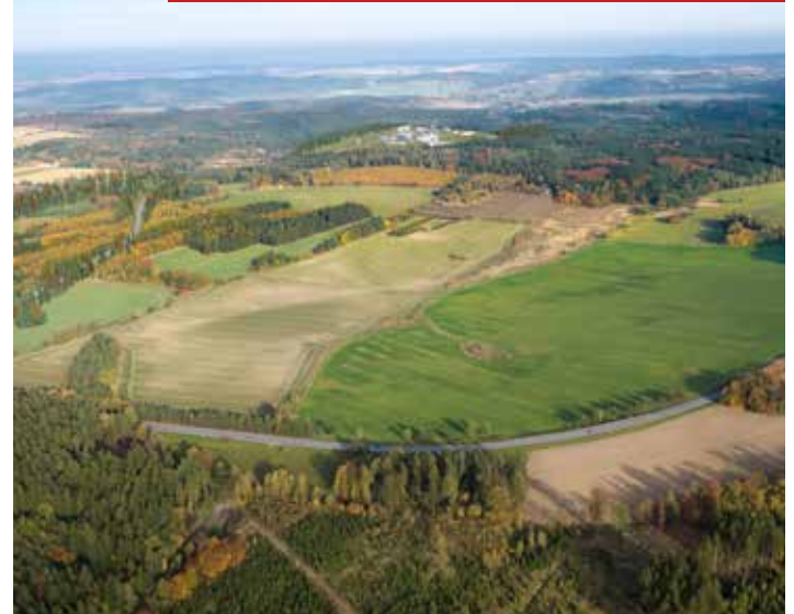
Vizualizace nadzemní části hlubinného úložiště