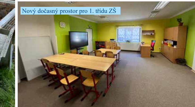
Nový dočasný prostor pro 1. třídu ZŠ