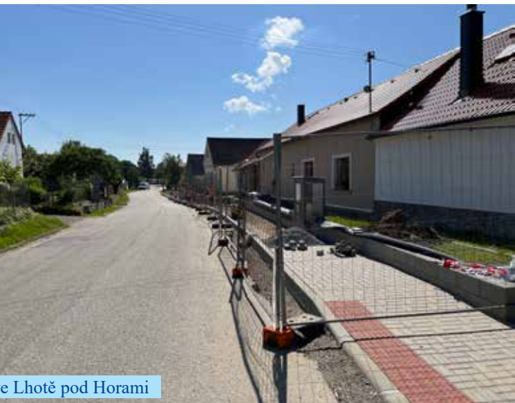
...e Lhotě pod Horami