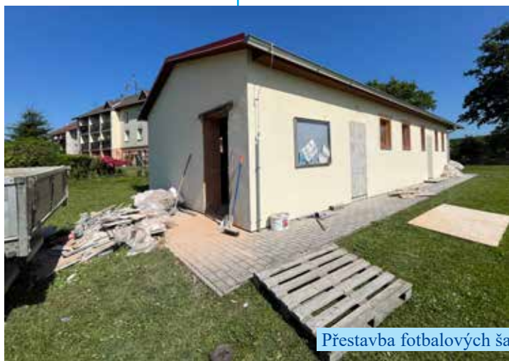
Přestavba fotbalových ša