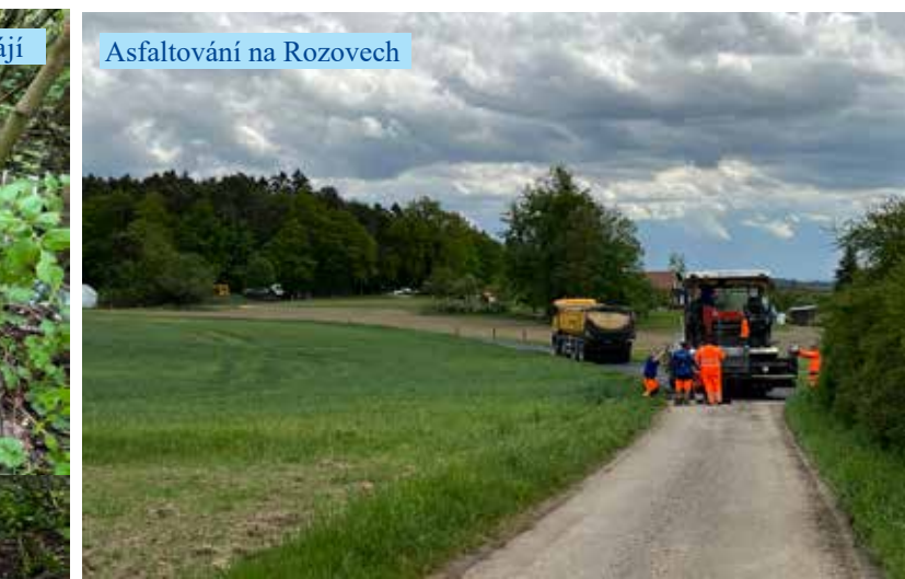
Asfaltování na Rozovech