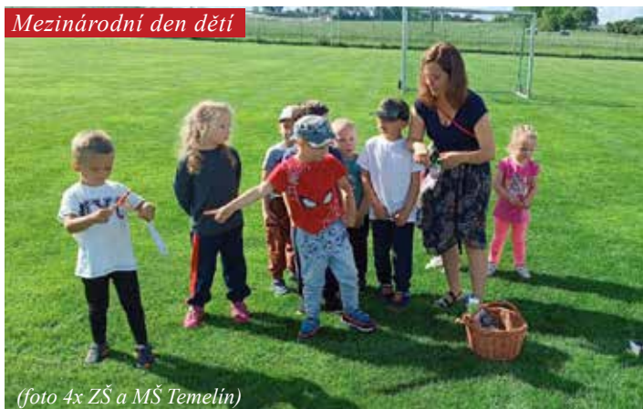
Mezinárodní den dětí