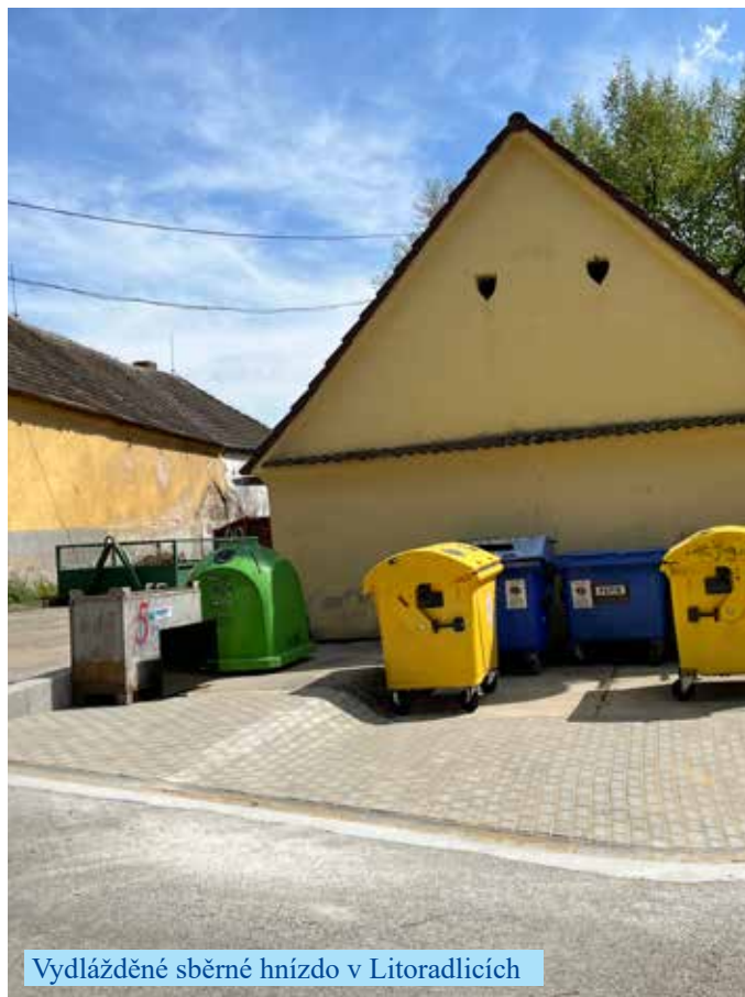
Vydlážděné sběrné hnízdo v Litoradlicích