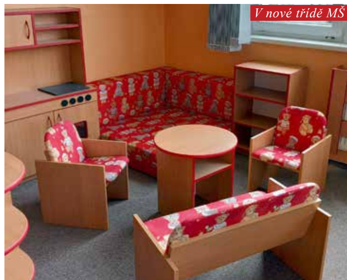
V nové třídě MŠ