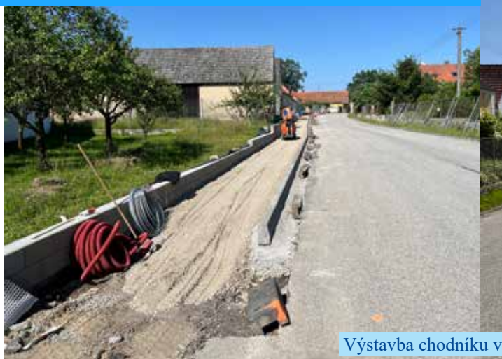
Výstavba chodníku v