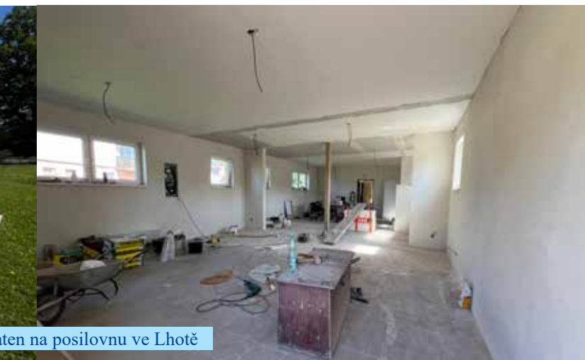
...nten na posilovnu ve Lhotě