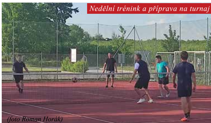
Nedělní trénink a příprava na turnaj