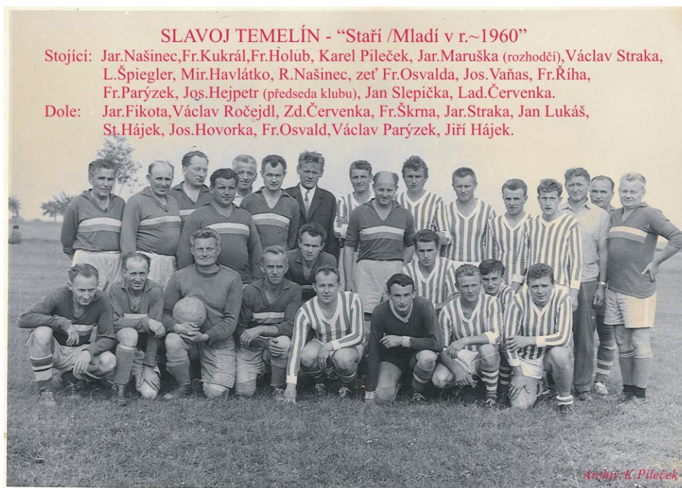
SLAVOJ TEMELÍN - "Staří /Mladí v r.~1960"

TJ Slavoj Temelín žádá všechny bývalé hráče, pamětníky, fanoušky, potomky hráčů, apod. o poskytnutí příspěvku ve formě informací, dokumentů či fotografií, pro chystanou knihu o historii sportovního klubu v Temelíně (uvítáme i ze zaniklého Podhájí), jež bude vydána k příležitosti 80. výročí založení klubu. Předem Vám děkujeme.